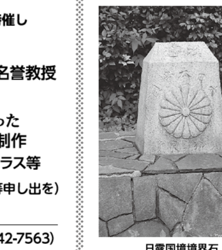
日露国境境界石 (明治神宮絵画館敷地内)

7月7日、品川支部教育宣伝部で「新宿区内の戦争遺跡見学会(※市ヶ谷亀岡八幡宮・防衛省正門・四ツ谷駅日御所トンネル・慶應義塾大学病院陸軍省境界石・国立競技場内学徒出陣碑・日露国境境界石・明治天皇国葬地跡・明治神宮絵画館)に参加してきました。