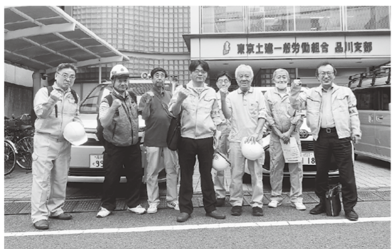
地元建設三組合共闘で現場訪問へ

7月11日(木)午後4時から、建設三組合共闘現場賃金調査行動」を、総計9名(※南都建設名・建設ユニオン3名・東京土建4名)の参加で、品川区立城南第二小学校改築工事に実施しました。 当日は雨予報で心配をしましたが、参加者の日頃の行ないが良かったせいか、雨に降られる事なく、行なうことが出来ました。 例年の現場訪問行動は、