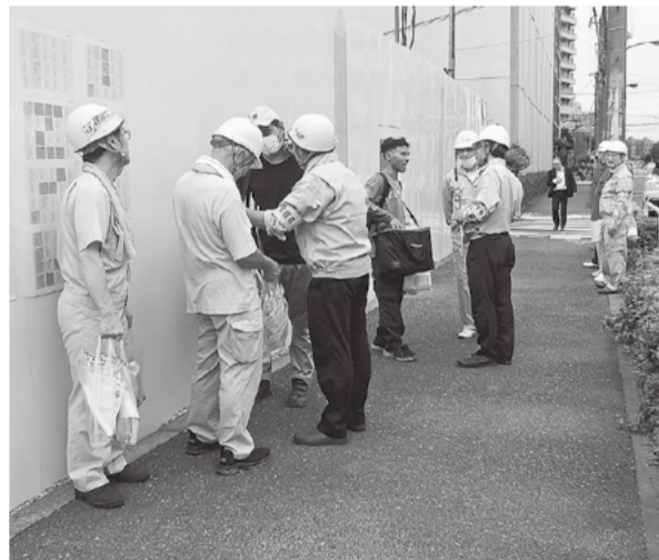
12人からアンケートを回収