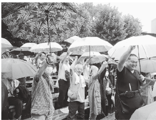
全国の仲間と氣勢をあげる

をあげました。 会期中でない中、賛同してくれている各派の国会議員の方々も多く足を運んで頂き、メッセージも多く寄せられていました。 参加した国会議員の一人ひとりに、要望書を手渡しに行き、建設国保を成・強化と、予算確保をお願いしました。