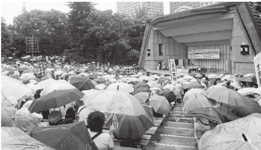
雨の中、全国から2001人が参加

移して、全建総連中央総決起集会(※全体で2001人が参加)が開催されました。 あいにくの雨の中、傘をさして濡れている椅子に座り、北海道から沖縄までの全国の建設労働組合の仲間達と氣勢