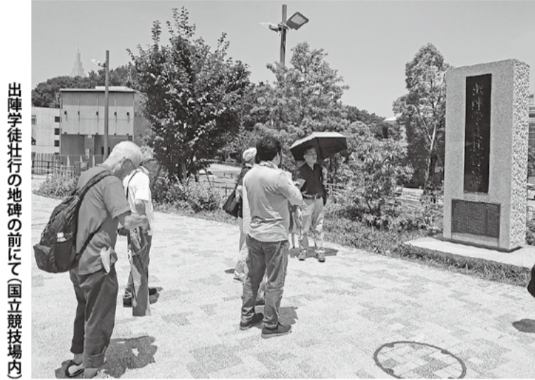
出陣学徒壮行の地碑の前にて(国立競技場内)

今回、教育宣伝部長となり、初めて平和取材に参加させて頂きました。テーマは「新宿区内の戦争遺跡見学会」という事で、市ヶ谷駅を出発し、信濃町駅まで各所を回るというものでした。「新宿という大都会に遺跡なんかあるのかな?」との思いもありましたが、各ポイントに向