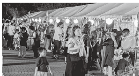
多くの来場者で賑わう