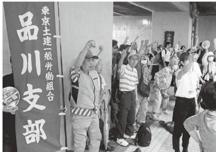
都庁前に1047人が参加