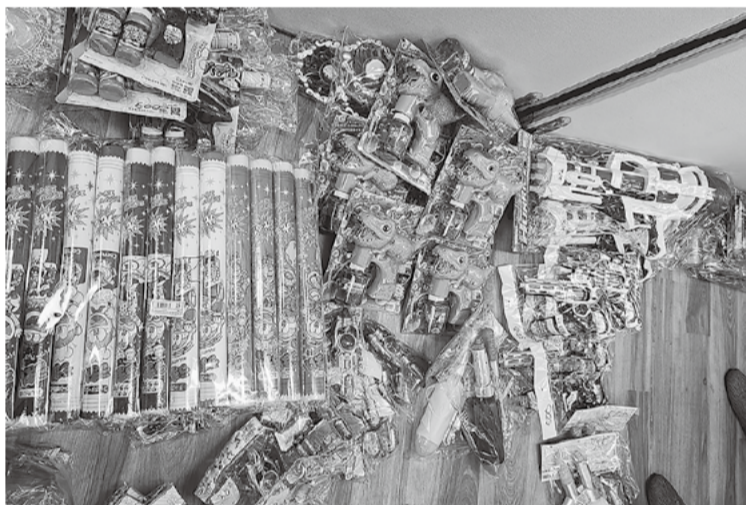
まずは分会事務所で仕分けから