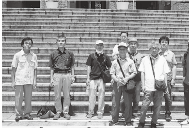
酷暑の中参加者一同で記念撮影

ここが国民を守っている、と感銘を受けた瞬間でしたが、情報だけ漏れパワハラ・無銭飲食等問題山積。 後日、218人が処分されたこと聞き、日本は平和だなあと思いました。