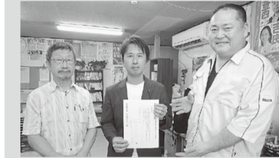
白石都議より賛同署名を受け取る(7/10)