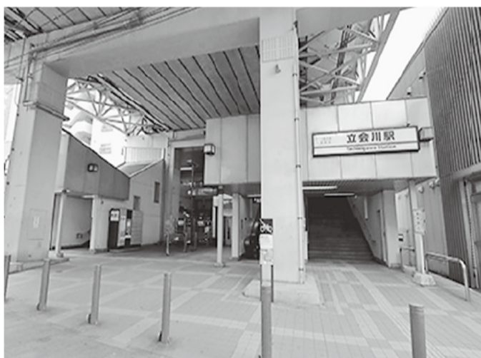
京浜急行「立会川駅」

ここ京浜急行『立会川駅』は急行が止まる駅です。通勤・通学で混雑する駅である立会川では日中は、競馬やフリーマーケットの人達がいまふ。駅の近くには『天祖諏訪神社』があり、品川の海側のお祭りは6月に終わつたと思えますが、この神社のお祭りは、9月13日(金)から15日(日)の三日間ですので、良かったら参加してみてください。