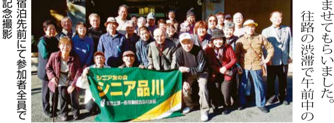
宿泊先前にて参加者全員で記念撮影

11月24日(日)~25日(月)、西伊豆町・堂ヶ島温泉方面への一泊親睦旅行を、初参加の方4名を含め、32名の参加で開催しました。