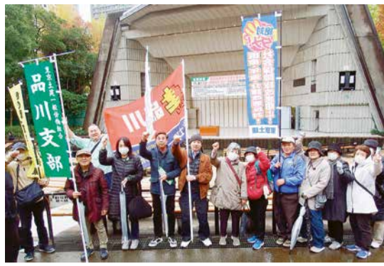
デモ行進に出発する仲間

11月21日(木)、朝の都庁に多くの仲間が集まり、「東京都連・対都要請行動」が開催されました。歯止めが効かない物価高騰、それを補うだけの賃金・単価のアップが見られない中、東京都に対して「建設国保育成・強化」「賃金・単価大幅引き上げ」のプラカードを参加者全員で掲げ、アピールを行いました。