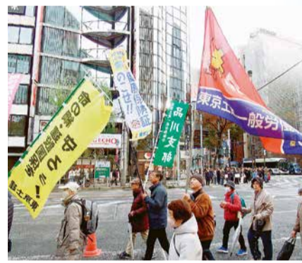
銀座・数寄屋橋をデモ行進

午後からは場所を日比谷野外音楽堂に移し、「全建総連中央総決起大会」が、47都道府県連・組合員約19万人(※品川支部から8人)が参加して行われました。東京駅近くまでデモ行進を行いました。当日集會に参加された組合員・家族の皆様本当にご苦労様でした。