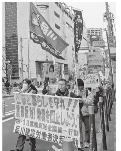
重税反対を訴え、デモ行進!

3度目となる、大井町へのデモ行進では、少し風が強かったものの、「インボイス制度廃止」「消費税減税」等を、参加した組合員・家族一丸となり、強く訴えました。電子申告が増えてきている中、集団申告を、荏原税務署に14名、品川税務署に6名で行ない、トラブル無く終えることができました。世界情勢も不安定で、先行きが見えにくくなっていますが、私たちの仕事・生活を守るべく「重税反対」を訴えていきましょう。 集会・デモ行進に参加していただいた、組合員・家族の皆様、大変お疲れ様でした。