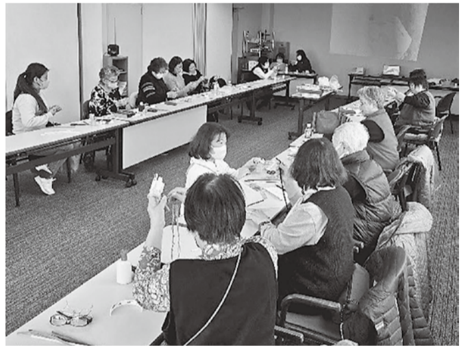
みんな大面ひとみ

分り易く、スムーズに進めることができました。1、2本目は、花びらを作るのに少し苦戦しましたが、一度コツをつかめば簡単にできました。材料も、丸えんぴつ、100円ショップで買えるモールドラワー等、手軽に揃える事ができます。