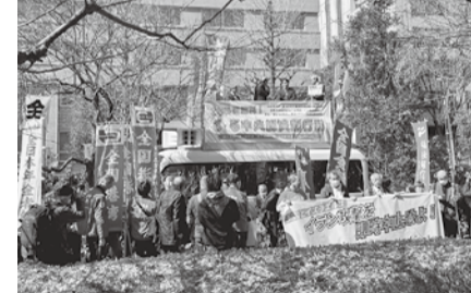
日比谷公園「かもめ広場」前にて

3月5日、日比谷公園「かもめ広場」と、その周辺の歩道を会場として開催された「26春闘勝利! 3・5中央総決起集会」に参加した。 全国から、労働組合の代表2000余名の参加があり、品川支部からは19名が参加した。 各代表の挨拶は、路肩に止められた車の屋根上の演壇から「適正な賃金・単価の実現」「担い手三法の確実な履行」「インボイス制度の廃止」「健康保険証の継続」等々が訴えられた。 集会後、衆参両議院面会所までのデモ行進があ