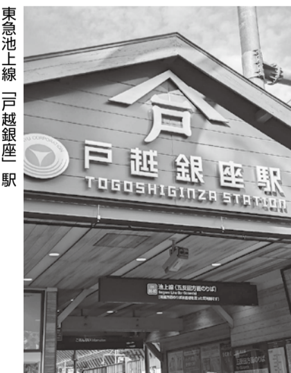
東急池上線 戸越銀座駅